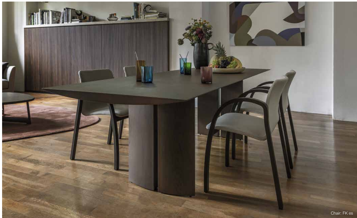
Chair: FK es

1992年発売のテーブル(TAVOLO NAVE)と1986年発売のチェア(FK)の復刻モデル。日々の食卓の家具として求められる耐久性、座り心地、使い勝手の良さを追求することで導き出されたフォルムは、使う人の暮らしの名脇役となるような、懐かしい機能美を感じさせます。